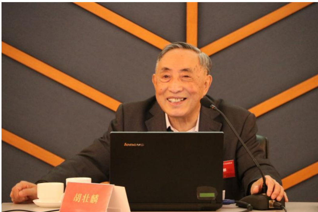
北京大学胡壮麟教授

北京大学胡壮麟教授以“英语语法及其发展史”为主题，和大家探讨了语法和语言学、语法与修辞、语法与哲学三个问题。他认为语法（史）和语言（史）的同步性这一议题具有复杂性，不能一概而论。此外，胡教授提出语法教学的三个原则：（i）英语语法教师需要认识到语法和逻辑相互制约的观点有其合理性，切忌选边站。（ii）作为英语为非母语学生的老师，在向学生讲授语法时多强调语法规则是必要的，这可以帮助他们更快地掌握英语。（iii）遇到不合传统语法的语言现象采取宽容的态度，并向学生说明其使用的语境和语用效果。最后，胡老先生鼓励大家多读书、思考，对于不懂的问题多了解、多研究。老师们都被胡老师严谨认真的学术态度所感染。